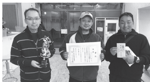
団体優勝：SAS-A チーム (SAS(株))