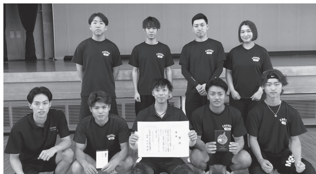
優勝：中興化成工業(株)松浦工場 チーム

3位：J-POWER ジェネレーションサービス(株) 松浦火力運営事業所 チーム