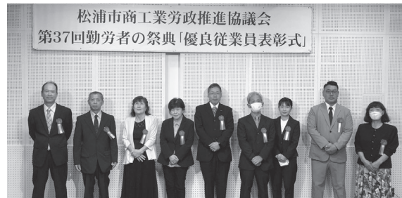
優良従業員表彰を受賞された方々