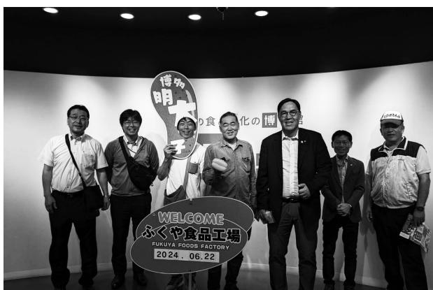
明太子工場ハクハク