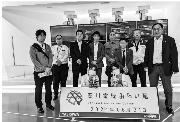
安川電機みらい館