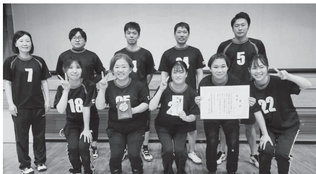
優勝:住商エアバッグ・システムズ(株) チーム