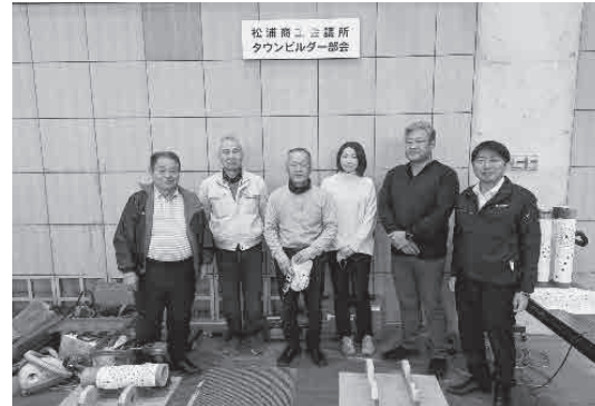
作業に参加した部会役員

も博」に部会役員（5人）が参加し、子供たちに「竹灯籠づくり」を体験していただきました。当日は、親子20組がチャレンジされましたが、1つ作るのに30分程かかるため、完成した竹灯籠に明かりを灯した時の子供たちは、あふれんばかりの笑顔でした。