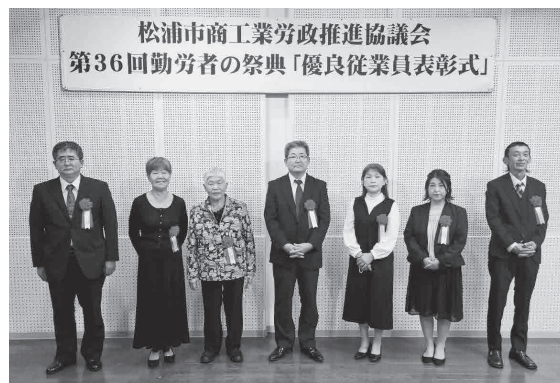
優良従業員表彰を受賞された方々 ※順不同、敬称略