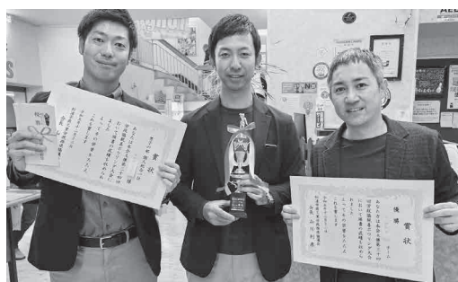
団体優勝：十八親和A チーム （株十八親和銀行松浦支店・松浦中央支店）