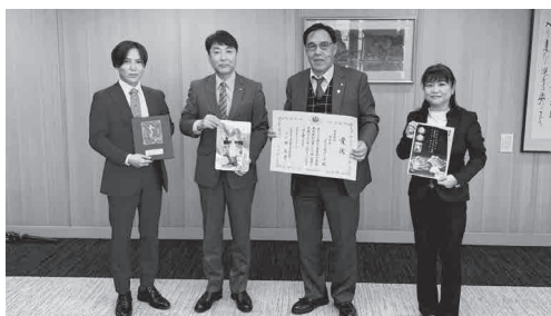
県庁浦副知事への受章報告

出品財は「酒屋が作ったレモンしめ鯖 香る炙り焼き仕上げ」で、松浦魚市場に水揚げされたマサバをレモンで漬け込んでから表面を炙り、真空包装後直ちにアルコールブラインにて急速凍結する新たなサバ加工品（しめさば）です。第60回長崎県水産加工振興祭でも農林水産大臣賞を受賞されており、ネット通販でも売れ筋No.1の人気商品となっています。