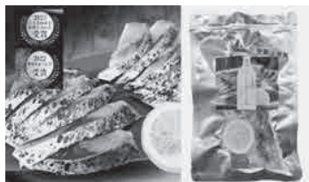
酒屋が作ったレモンしめ鯖 香る炙り焼き仕上げ